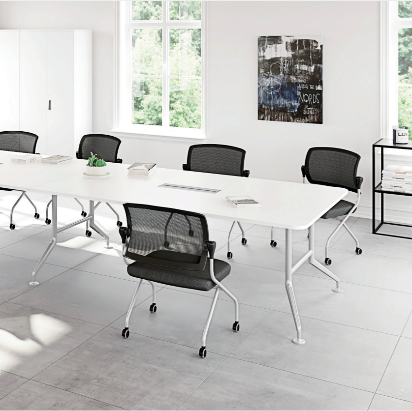
WC11 회의용 탁자