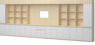
칠판 보조장 인출식 로커형

24761763 / 4,600,000 MCB223004 W6036 * D420 * H2400