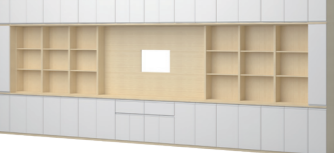
칠판 보조장 상부수납형

24761767 / 5,400,000 MCB223008 W6800 * D420 * H2400