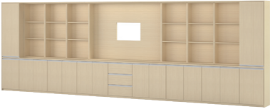
칠판 보조장 인출식 로커형

24386074 / 3,800,000 WM1006TC W5400 * D430 * H2113