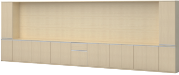
칠판 보조장 인출식 로커형

24386075 / 3,180,000 WM1007TC W5400 * D430 * H2113